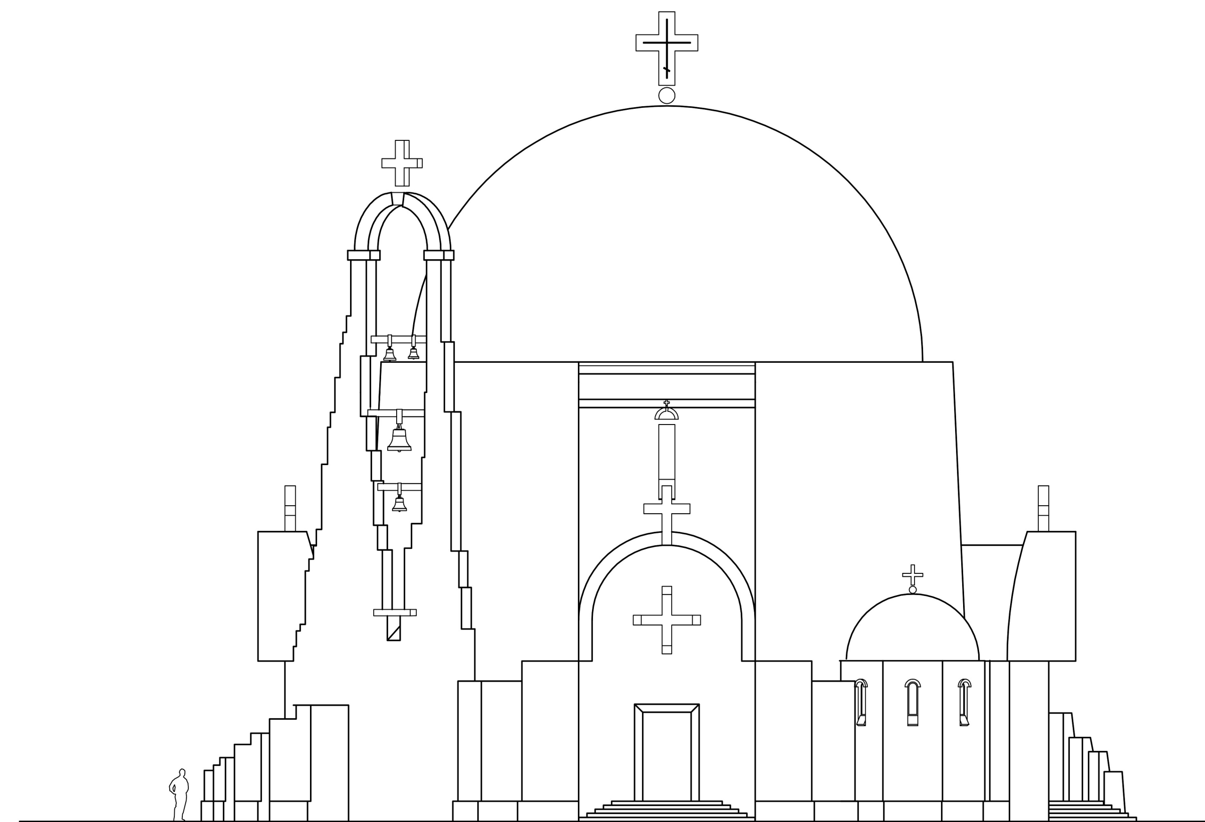
западный фасад храма

1- алтарь; 1.1- престол; 1.2- жертвенник; 1.3- горнее место; 1.4- синтронон; 1.5- запрестольный крест; 1.6- семисвечник; 2- храм-наос; 2.1- солея; 2.2- клиросы; 2.3- амбит; 2.4- иконостас; 2.5- архиерейский амвон; 2.6- аналой; 2.7- паникадило-хорос; 3- часовня-придел Св. Иякова; 1.1- престол; 1.2- жертвенник; 1.3- арка иконостаса; 4- притвор-пронаос; 5- ризница-диаконник; место облачения отдыха священнослужителей; шкаф/сейф для сосудов и богослужбных книг; вытяжной канал для каддила; рукомоийник; 6- часовня-крещальня Таинства Крещения; 6.1- купель; 6.2- апсида; 7- колокольня/звонница; 8- киоск-иконная лавка, крестной ящик; 9- лестница в колокольню/звонницу; 10- подсобно-вспом. помещение; 11- пандус